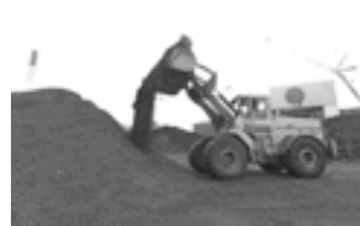
Regeringens mål for 2008